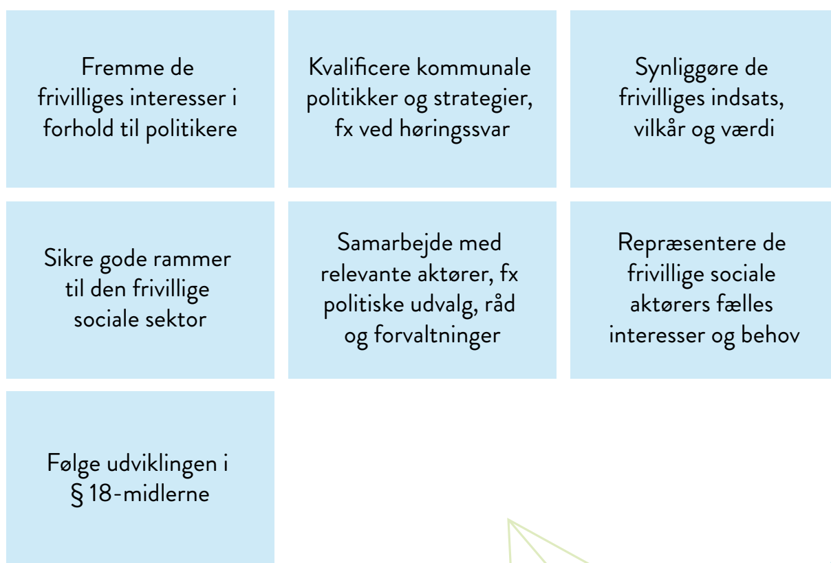
Figur 1: De lokale frivilligråds typiske opgaver